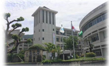
安陵の地にそびえる校舎