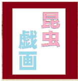
波乱万丈、虫たちの悲喜ごもごも!

昆虫について面白く知ることができる本です。『鳥獣戯画』のようなタッチとデフォルメで虫を描いていて、とてもかわいくなっているの虫が苦手な人でも楽しく読めると思います。これを読んで僕たちの様な虫好きに理解を示してほしいです。