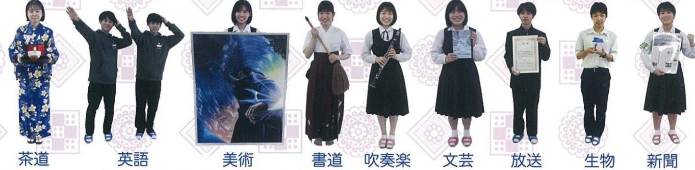
茶道 英語 美術 書道 吹奏楽 文芸 放送 生物 新聞