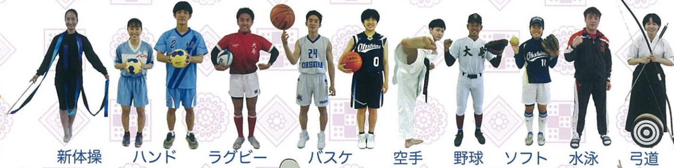
新体操 ハンド ラグビー バスケ 空手 野球 ソフト 水泳 弓道