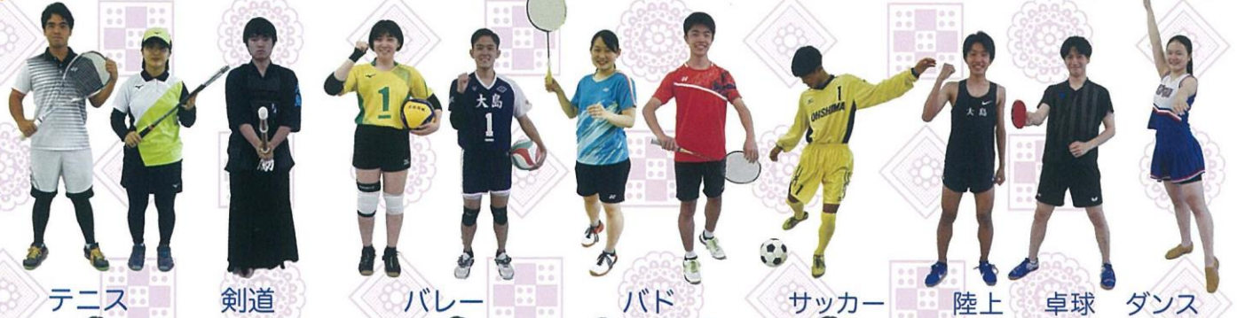
テニス 剣道 バレー バド サッカー 陸上 卓球 ダンス