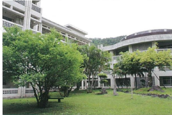
緑豊かな中庭を囲む開放感のある校舎

鹿児島県立大島高等学校は九州の南西380kmにある奄美大島のほぼ中心に位置する普通科の進学校です。通称「大高」と呼ばれる本校は「和親」「協同」「自治」「奉仕」を校訓とし、今年で創立120周年を迎えます。