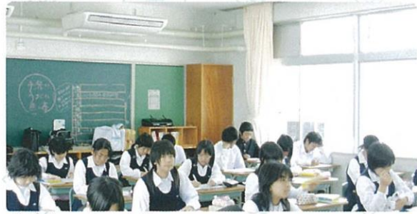
全教室エアコン完備