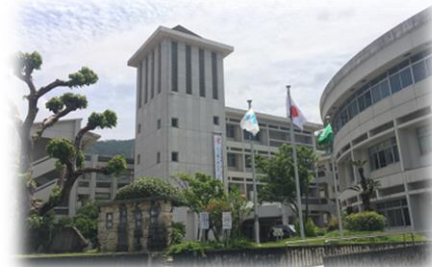
安陵の地にそびえる校舎